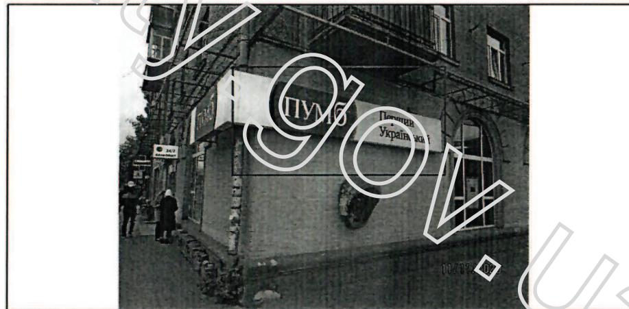
Фото фасада будинку розміщення спеціальної тимчасової/стаціонарної конструкції: