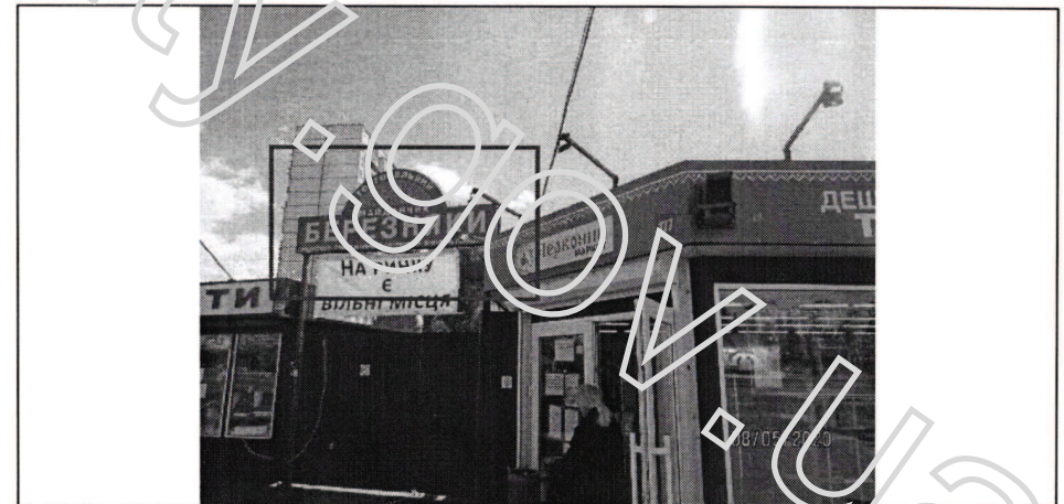
Фото фіксації розміщення спеціальної тимчасової/стаціонарної конструкції: